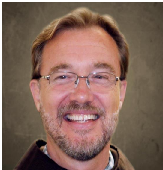
Mgr Pierre Charland, franciscain Évêque élu du diocèse de Baie-Comeau

UN PETIT GESTE QUI FAIT LA DIFFÉRENCE. MERCİ À TOUS LES PARTICIPANTS.